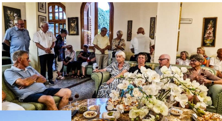
Hotel Ipanema ved Taormina

Herefter en lang køretur til vores hotel for de næste fire dage, Hotel Ipanema ved Taormina. Hertil ankom vi efter klokken 19, med indtjekning og aftensmad umiddelbart efter. Desværre havde kokken ikke sin bedste dag.